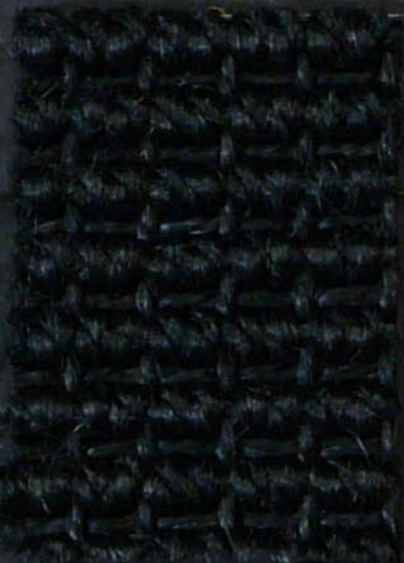
Brahma 299 nero