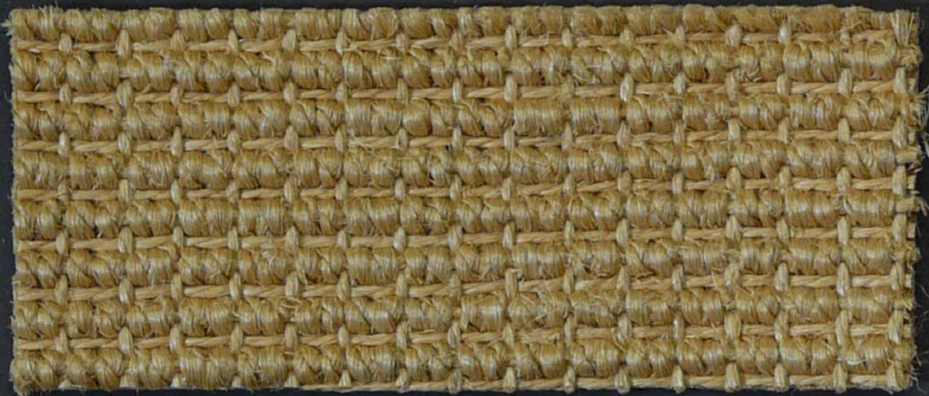
Brahma 230 natur