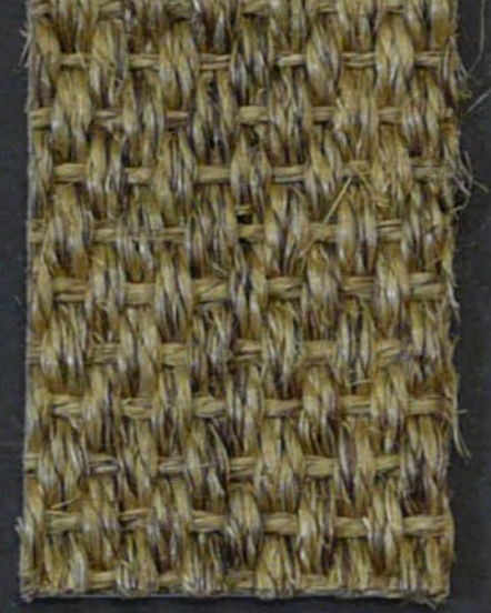
Amazone 145 mais