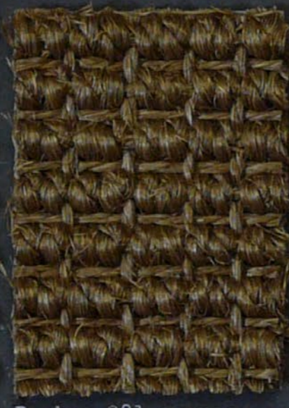
Brahma 281 cognac