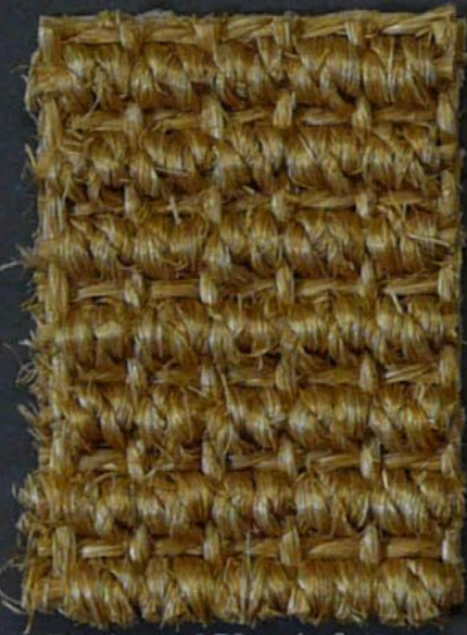
Brahma 231 miele