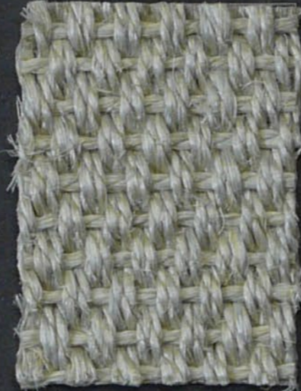
Amazone 160 alabastro