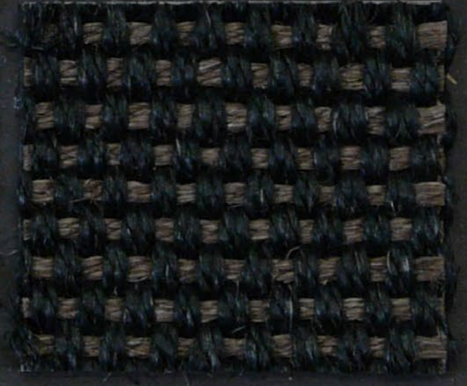
Amazone 102 nero/topo