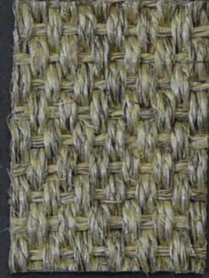
Amazone 125 granito