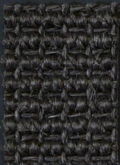
Brahma 290 taupe