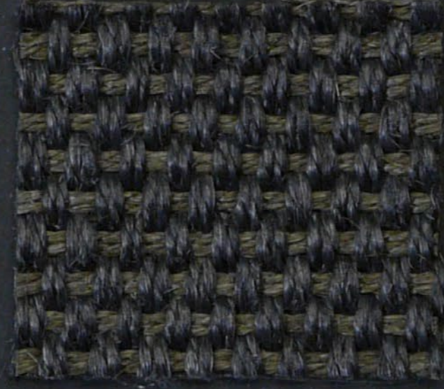
Amazone 105 grigio/topo