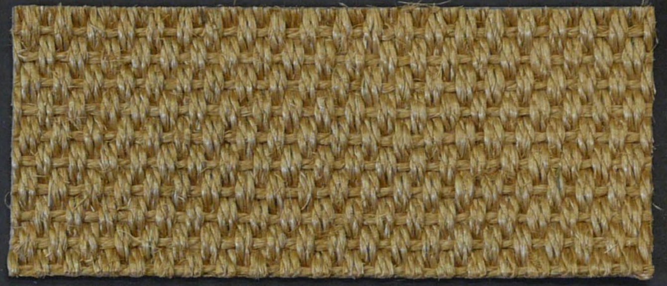
Amazone 130 natur